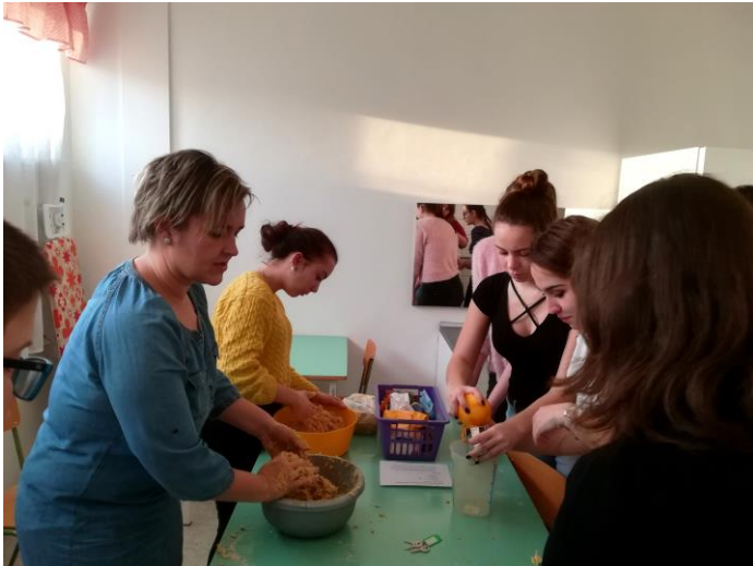
Készül a zabpelyhes keksz. Szeretettel készült - isteni lett!