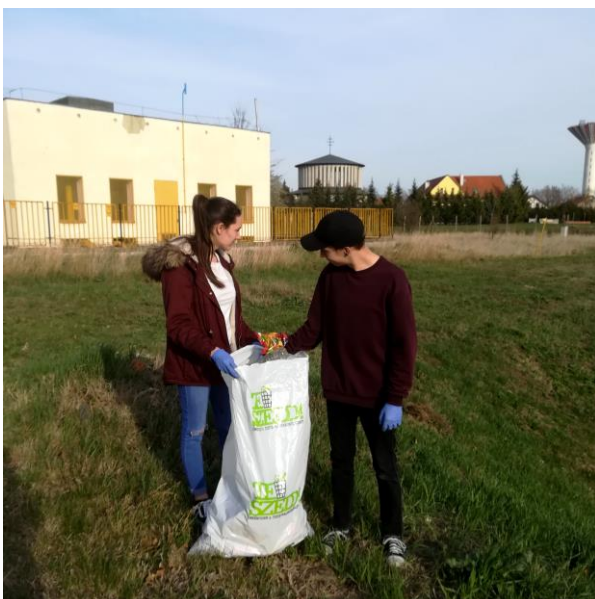
A Te Szedd! akcióhoz is csatlakoztunk