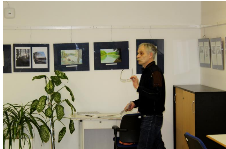
Rajz és fotópályázat alkotásai