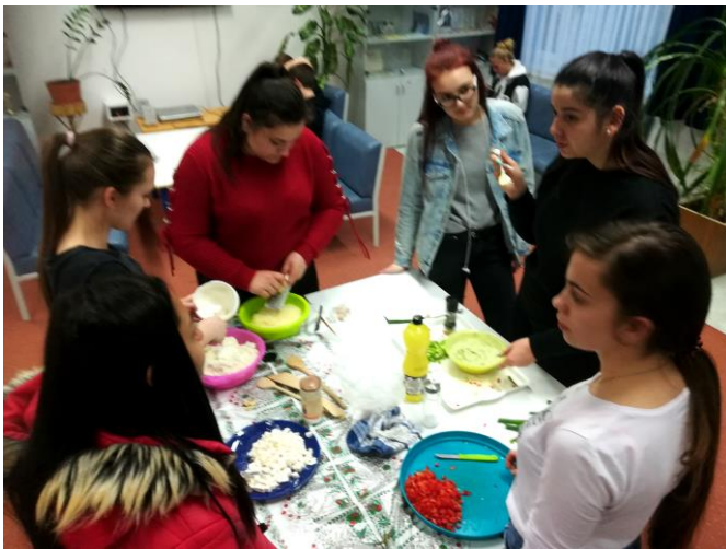
Készülnek a zöldségkrémek