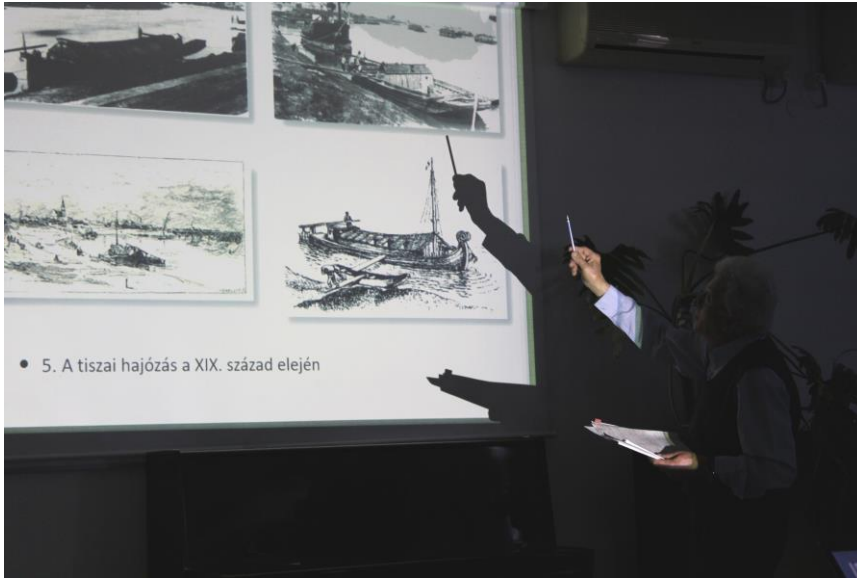
Előadás a Tiszáról