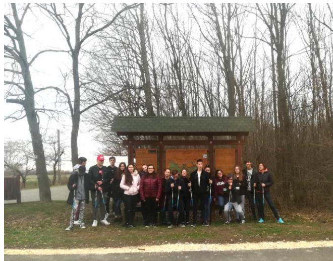
Nordic walking-ozók ☺